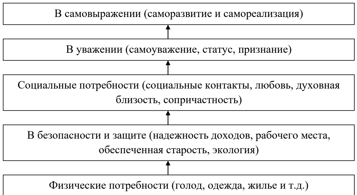
Рисунок 1.2. Иерархия потребностей Абрахаама Маслоу